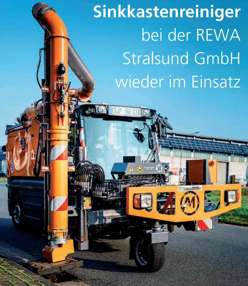
Der Sinkkastenreiniger Swingo 200+ SKR bei der Arbeit.

Dies gewährleistet einen ordnungsgemäßen Ablauf des Oberflächenwassers von den Straßen. »Laub, Sand, Kies und andere Verschmutzungen werden über das Saugrohr im 2 m 3 großen Behälter in der Maschine gesammelt. Der Fahrer ist weder Witterungsverhältnissen noch körperlicher Arbeit ausgesetzt. Durch die elektrohydraulische Bedienung und dem voll mechanisierten Reinigungsvorgang ist eine schnelle und effiziente Reinigung und eine hohe Tagesleistung gewährleistet.« (Aebi Schmidt Group). ■