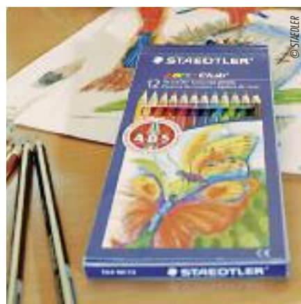
Auch für feinmotorisch Ungeübte gut geeignet.

Dies wird durch die ergonomisch geformten Griffmulden gewährleistet. griffix® wurde für den Designpreis der Bundesrepublik Deutsch-