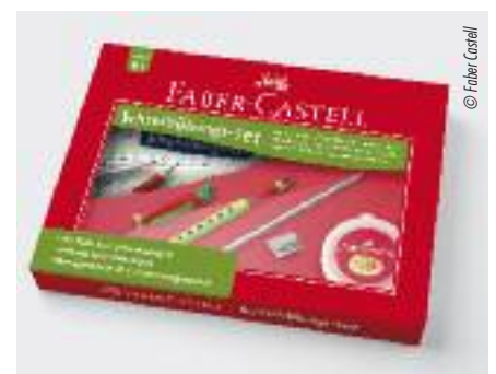
Übungen mit diesem Schreibset verfeinern das Schriftbild.

Der neue Schulfüller und der neue Tintenroller von Faber-Castell unterstützen die richtige Haltung bei den ersten Schreibversuchen, denn die Mulden seines Griffstücks geben jedem Finger die optimale Position für den Dreifingergriff vor – auch in einer Ausführung für Linkshänder.