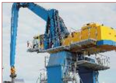
13 | Ein Hydraulik-Portalkran mit Raupenfahrwerk als neue Krantechnik im Südhafen.