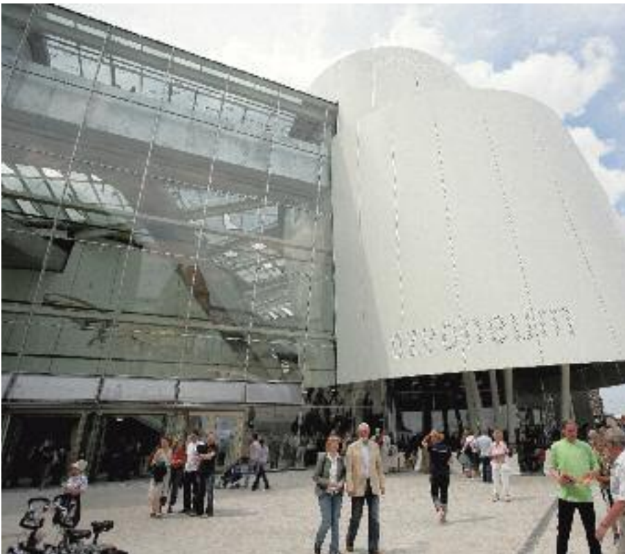
Für unser Kreuzworträtsel stellt das Ozeaneum 5 x 2 Freikarten zur Verfügung.

Zur Zeit laufen 5 Dauerausstellungen im Wechsel mit unterschiedlichen Sonderausstellungen. Besonders zu empfehlen ist die einzigartige Delfin-Sonderausstellung im Ozeaneum, die noch bis zum 31. Oktober 2008 läuft.