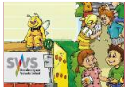
8 | Ein Stundenplan zum Herausstreifen mit Eddy Energy für die jüngsten Schulkinder.