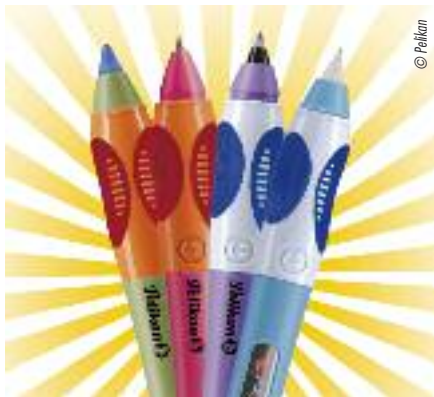
Neben der Farbe steht bei Pelikan die Ergonomie im Mittelpunkt.

Wenn man aber darauf achtet, dass ein Linkshänder das Schreibgerät von Anfang an weiter oben anfasst, kann er das Geschriebene über die Schreibspitze hinweg besser sehen. Schreibgeräte mit einer etwas breiteren Spitze erleichtern das Schieben der Schrift und die Feder bleibt nicht mehr im Papier hängen. Ein spezieller Füller mit Linkshänderfeder ist sicher sinnvoll. Angesichts der negativen Auswir-