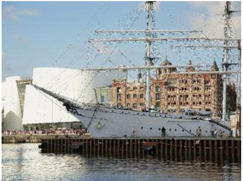
Hafenansicht: Ozeaneum, daneben der Dornröschenspeicher und im Vordergrund die Gorch Fock.

Nach der Abwicklung des volkseigenen Betriebes, Anfang der neunziger Jahre, stand der Speicher leer und wurde 1998 von einem Privatinvestor erworben. Seit dieser Zeit wurde der „Dornröschenspeicher“, wie er auch im Volksmund bezeichnet wird, durch die SES – Stadterneuerungsgesellschaft mbH Stralsund bautechnisch gesichert. Bis zum Jahr 2007 stand der Speicher weiterhin leer. Erst mit dem Bau des Ozeaneums sollte er in den Folgejahren aus seinem Dornröschenschlaf erweckt und mit einer neuen Bestim-