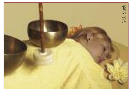
14 | Unser neuer local*card-Partner sorgt mit dem Yoga- und Gesundheits-Studio für Entspannung und Wohlbefinden.