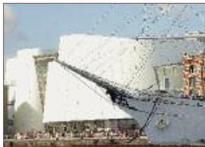
5 | Die neue Hafenattraktion Ozeaneum wird mit 100% Ökostrom der SWS Energie versorgt.