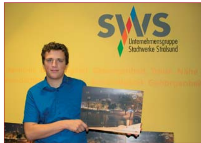
9 | Großer Andrang bei Verlosungsaktion