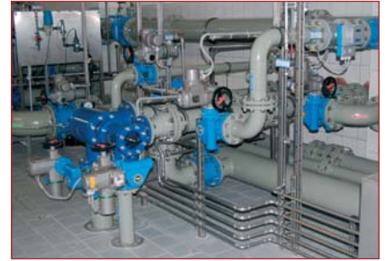
6 | Neuer Härtegrad für Trinkwasser