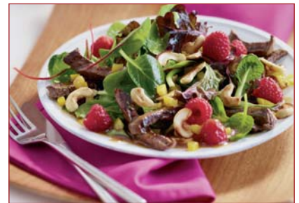
11 | Coupon-Aktion zum Jahresende