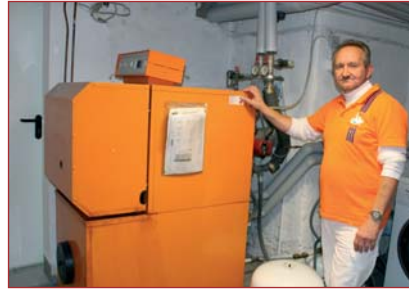
4 | Mit StrelaWärme zur neuen Heizungsanlage